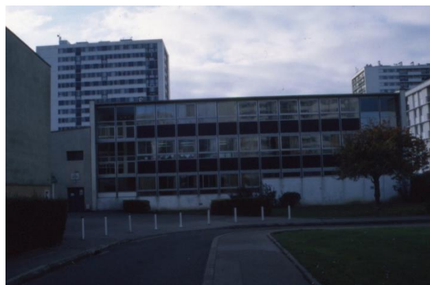
École André-Gide.

dont une classe d'enseignements ménagers, et onze classes élémentaires de garçons dont une classe de travaux manuels. Les travaux commencent ensuite rapidement et le groupe scolaire est mis en service dès la rentrée suivante, mi-septembre 1967 . Etant donné que la disposition des lieux permet un passage facile de l'école élémentaire de filles à la maternelle, certaines classes peuvent être attribuées à des élèves de l'un ou de l'autre de ces niveaux, en fonction des besoins liés aux effectifs.