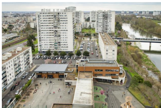
École Duhamel-Gide, 2022.

Avant l'ouverture de l'école Simone-Veil dans le quartier des Deux-Lions en 2019, le groupe scolaire Duhamel-Gide prenait en charge tellement d'élèves qu'à défaut de place dans les classes, ils étaient installés dans la bibliothèque et les locaux périscolaires. Ces salles étaient donc privées de leur utilité initiale.