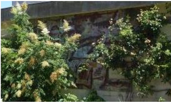
Figure 1: Oeuvre de Hélène Delaroche-Untersteller pour le groupe scolaire Saint-Exupéry © Ville de Tours/Kamel Ayeb.

En 1975, l'école obtient une décoration au titre du 1% artistique . L'œuvre, réalisée par l'artiste Hélène Delaroche-Untersteller , est constituée de panneaux en dalles de lave recouverts d'émaux .