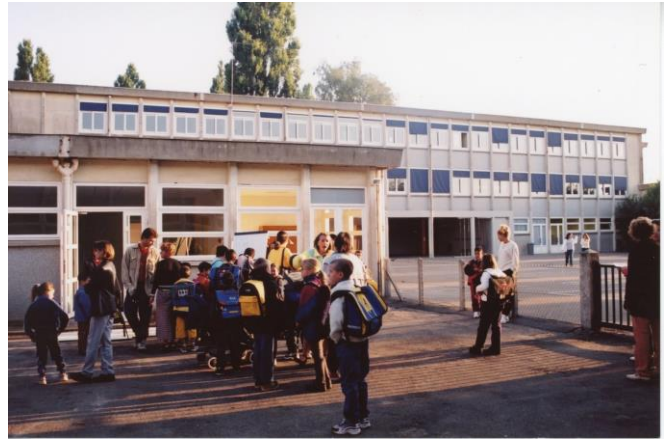
Ecole Saint-Exupéry. Archives municipales de Tour, EXU7DOIII.

En 1971, avec l'introduction de la mixité à l'école, l'ancienne école de filles est dénommée Alain-Fournier. L'ancienne école de garçons conserve le nom de Saint-Exupéry. Aujourd'hui, les deux écoles élémentaires portent simplement le nom de Saint-Exupéry. Le 12 novembre 1973, pour éviter les confusions, le conseil municipal décide de dénommer l'école maternelle Saint-Exupéry différemment de l'école élémentaire. Elle est alors appelée école maternelle Croix-Pasquier.